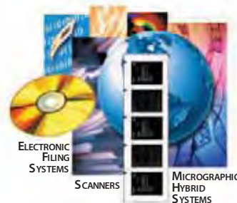
Image Filing Systems Division Authorized Full Line Dealer Network